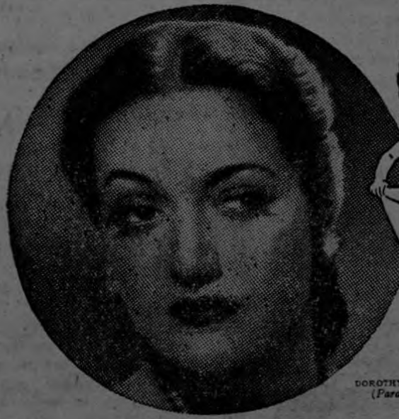
DOROTHY LAMOUR

Mensaje de Hermosura de una Estrella del Cine para usted