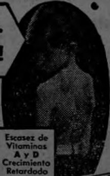
Escasez de Vitaminas A y D Crecimiento Retardado