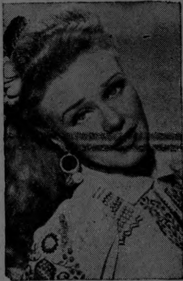
GINGER ROGERS, la adorable estrella de RKO-Radio Pictures, no presenta ningún problema de clasificación, según el experto de Hollywood Max Factor Jr., puesto que pertenece decididamente al tipo "rubio".

La mujer que se hace su ideal mental, con limpieza de intención; es decir, sin miedos ni temblores; la mujer que se hace su ideal mental y luego ordena las capacidades de su vida, para hacerse digna de ese ideal, logrará lo que desea, aunque por el momento, las cir-